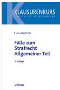
Fälle zum Strafrecht Allgemeiner Teil Ladenpreis: 25,60EUR