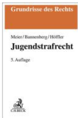
Jugendstrafrecht Ladenpreis: 33,90EUR