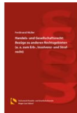
Handels- und Gesellschaftsrecht: Bezüge zu anderen Rechtsgebieten (u. a. zum Erb-, Insolvenz- und Strafrecht) Ladenpreis: 46,30EUR