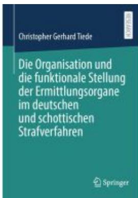
Die Organisation und die funktionale Stellung der Ermittlungsorgane im deutschen und schottischen Strafverfahren Ladenpreis: 92,51EUR