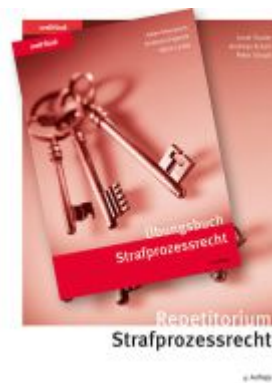
Strafrecht Kombipaket Ladenpreis: 76,10EUR