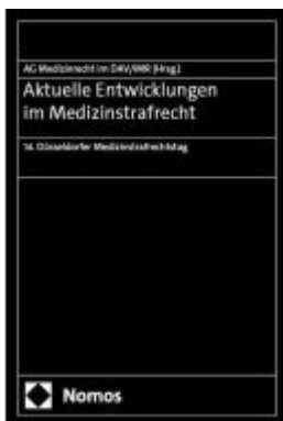
Aktuelle Entwicklungen im Medizinstrafrecht Ladenpreis: 50,40EUR