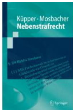
Nebenstrafrecht Ladenpreis: 25,65EUR

Wir haben andere Produkte gefunden, die Ihnen gefallen könnten!