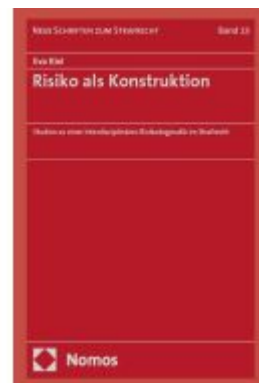
Risiko als Konstruktion Ladenpreis: 132,70EUR