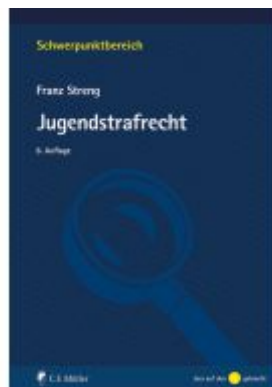
Jugendstrafrecht Ladenpreis: 26,80EUR