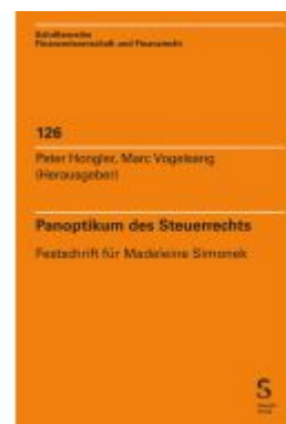
Panoptikum des Steuerrechts Ladenpreis: 175,20EUR