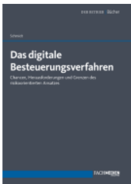
Das digitale Besteuerungsverfahren Ladenpreis: 41,10EUR