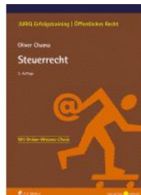
Steuerrecht Ladenpreis: 22,70EUR