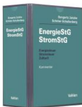
Energiesteuer, Stromsteuer, Zolltarif Ladenpreis: 101,80EUR