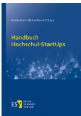
Handbuch Hochschul-StartUps Ladenpreis: 122,40EUR