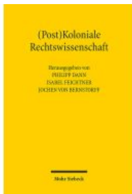
(Post)Koloniale Rechtswissenschaft Ladenpreis: 122,40EUR