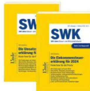
Die Steuererklärungen für 2024 - Band 1 + 2 Ladenpreis: 52,00EUR