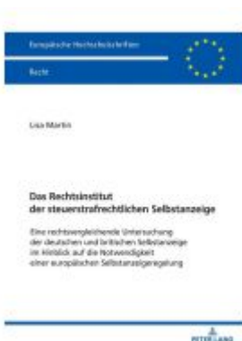
Das Rechtsinstitut der steuerstrafrechtlichen Selbstanzeige Ladenpreis: 68,80EUR