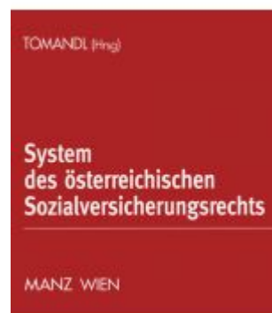
System des österreichischen Sozialversicherungsrechts Ladenpreis: 258,00 EUR