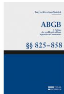
Großkommentar zum ABGB - Klang Kommentar Ladenpreis: 160,00 EUR