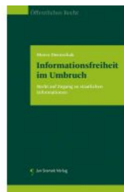
Informationsfreiheit im Umbruch Ladenpreis: 98,00 EUR