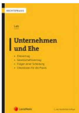
Unternehmen und Ehe Ladenpreis: 39,00 EUR