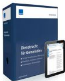
Dienstrecht für Gemeinden Ladenpreis: 239,80 EUR