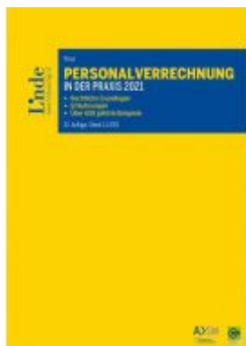
Personalverrechnung in der Praxis 2021 Ladenpreis: 105,00 EUR