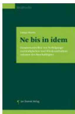
Ne bis in idem Ladenpreis: 74,00 EUR