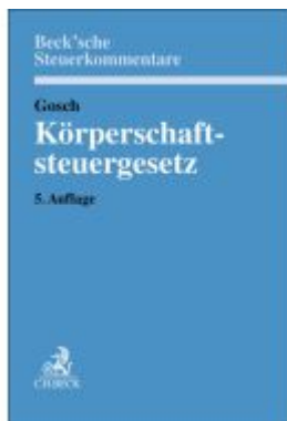
Körperschaftsteuergesetz Ladenpreis: 225,20EUR

Wir haben andere Produkte gefunden, die Ihnen gefallen könnten!