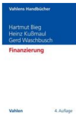
Finanzierung Ladenpreis: 46,20EUR