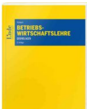
Betriebswirtschaftslehre Ladenpreis: 38,00EUR