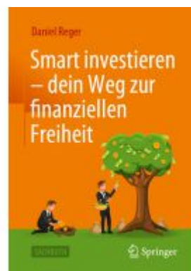
Smart investieren – dein Weg zur finanziellen Freiheit Ladenpreis: 30,83EUR