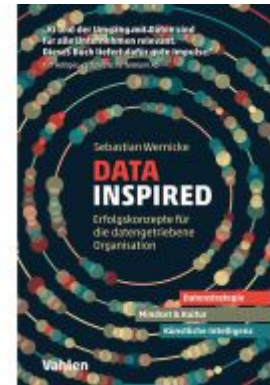
Data inspired Ladenpreis: 30,70EUR