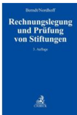
Rechnungslegung und Prüfung von Stiftungen Ladenpreis: 132,70EUR