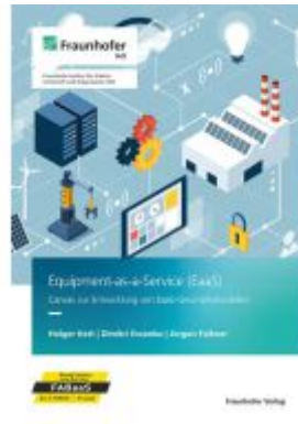
Equipment-as-a-Service (EaaS) Ladenpreis: 46,30EUR