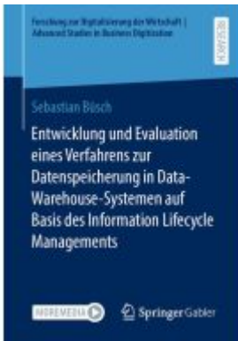
Entwicklung und Evaluation eines Verfahrens zur Datenspeicherung in Data- Warehouse-Systemen auf Basis des Information Lifecycle Managements Ladenpreis: 77,09EUR