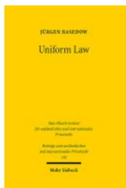
Uniform Law Ladenpreis: 132,70EUR