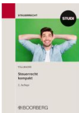
Steuerrecht kompakt Ladenpreis: 17,40EUR