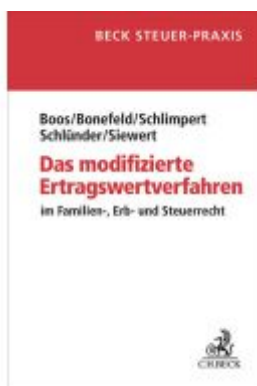
Das modifizierte Ertragswertverfahren Ladenpreis: 81,30EUR