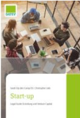
Start-up Ladenpreis: 22,66EUR