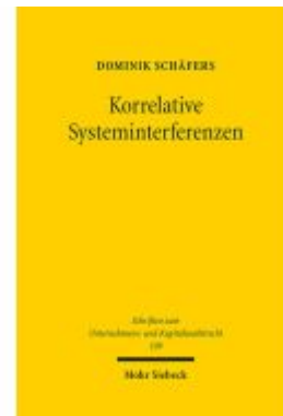
Korrelative Systeminterferenzen Ladenpreis: 153,20EUR