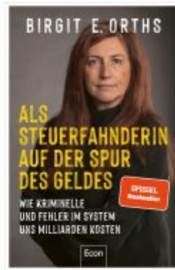
Als Steuerfahnderin auf der Spur des Geldes Ladenpreis: 20,60EUR