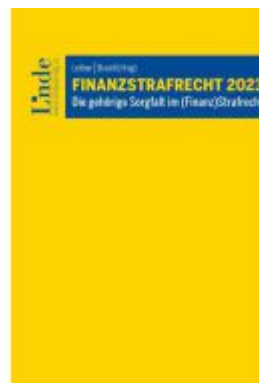
Finanzstrafrecht 2023 Ladenpreis: 59,00EUR