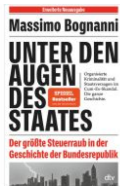
Unter den Augen des Staates Ladenpreis: 14,40EUR