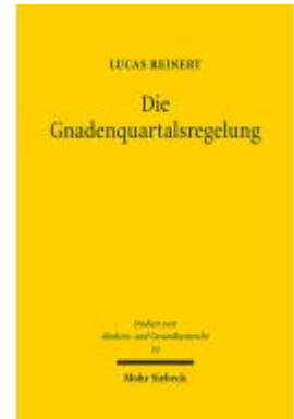
Die Gnadensquartalsregelung Ladenpreis: 91,50EUR