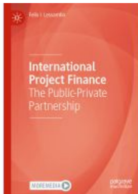
International Project Finance Ladenpreis: 153,99EUR