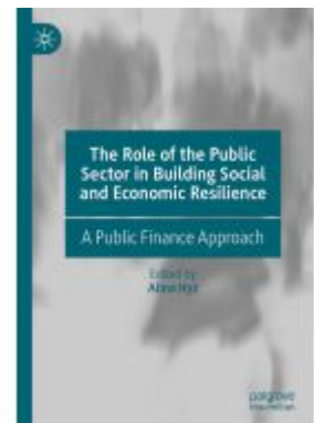
The Role of the Public Sector in Building Social and Economic Resilience Ladenpreis: 186,99EUR