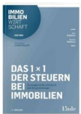
Das 1 x 1 der Steuern bei Immobilien Ladenpreis: 39,00EUR