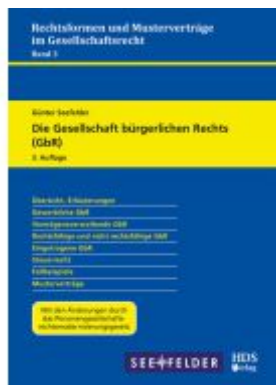
Die Gesellschaft bürgerlichen Rechts (GbR) Ladenpreis: 51,30EUR