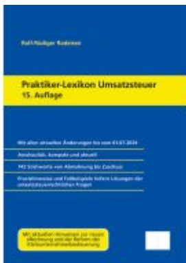
Praktiker-Lexikon Umsatzsteuer Ladenpreis: 102,70EUR