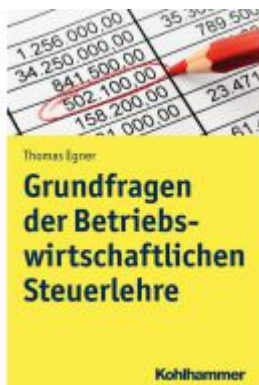
Grundlagen einer entscheidungsorientierten Steuerlehre Ladenpreis: 30,90EUR