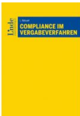
Compliance im Vergabeverfahren Ladenpreis: 48,00EUR