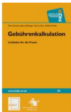
Gebührenkalkulation Ladenpreis: 44,80EUR