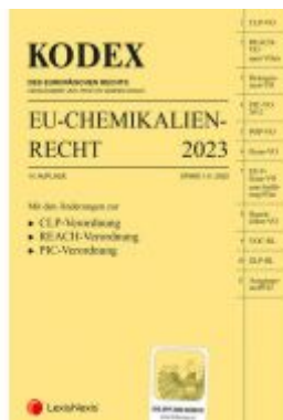
KODEX EU-Chemikalienrecht 2023 - inkl. App Ladenpreis: 99,00EUR