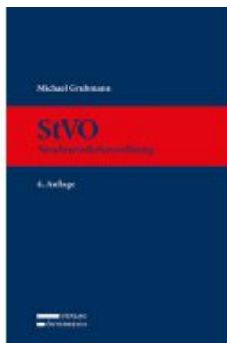
StVO Ladenpreis: 349,00EUR