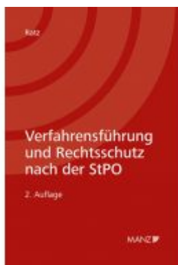
Verfahrensführung und Rechtsschutz nach der StPO Ladenpreis: 98,00EUR