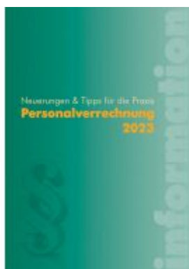
Personalverrechnung 2023 Ladenpreis: 44,00EUR