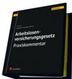
Arbeitslosenversicherungsgesetz - Praxiskommentar Ladenpreis: 290,00EUR

Wir haben andere Produkte gefunden, die Ihnen gefallen könnten!