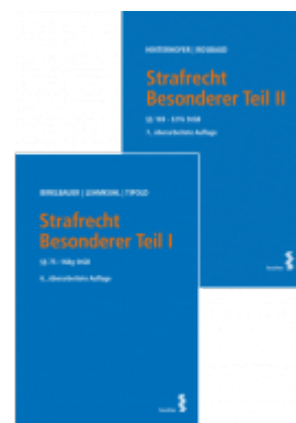
Kombipaket Strafrecht Besonderer Teil I und Besonderer Teil II Ladenpreis: 82,00EUR