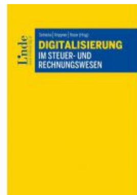
Digitalisierung im Steuer- und Rechnungswesen Ladenpreis: 79,00EUR