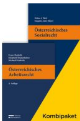
Kombipaket Österreichisches Arbeitsrecht und Österreichisches Sozialrecht Ladenpreis: 104,00EUR