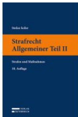
Strafrecht Allgemeiner Teil II