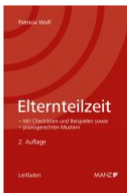
Elternteilzeit Ladenpreis: 46,00EUR