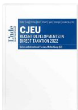
CJEU - Recent Developments in Direct Taxation 2022 Ladenpreis: 85,00EUR