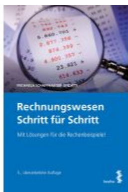
Rechnungswesen Schritt für Schritt