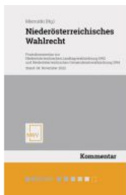
Niederösterreichisches Wahlrecht Ladenpreis: 118,00EUR