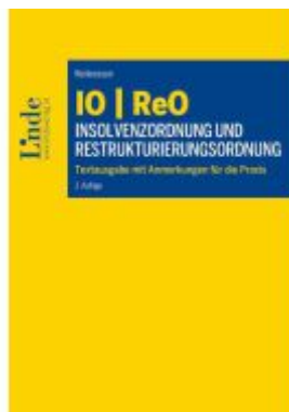
IO | ReO Insolvenzordnung und Restrukturierungsordnung Ladenpreis: 89,00EUR