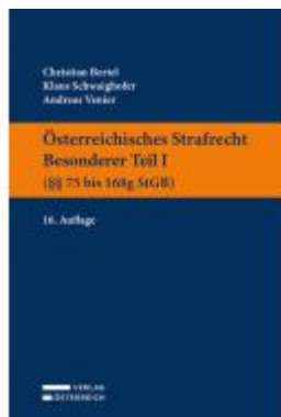
Österreichisches Strafrecht. Besonderer Teil I (§§ 75 bis 168g StGB) Ladenpreis: 39,00EUR

Wir haben andere Produkte gefunden, die Ihnen gefallen könnten!