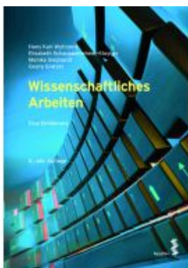
Wissenschaftliches Arbeiten Ladenpreis: 22,00EUR