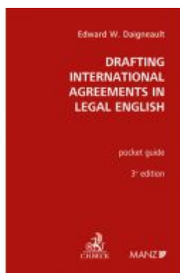
Drafting International Agreements in Legal English Ladenpreis: 36,00EUR