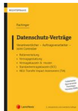
Datenschutz-Verträge Ladenpreis: 49,00EUR