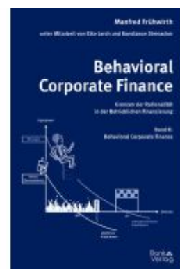
Behavioral Corporate Finance - Grenzen der Rationalität in der Betrieblichen Finanzierung Ladenpreis: 74,00EUR