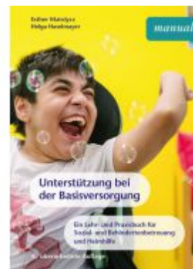
Unterstützung bei der Basisversorgung Ladenpreis: 26,90EUR