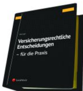
Versicherungsrechtliche Entscheidungen - aufbereitet für die Praxis Ladenpreis: 329,00EUR