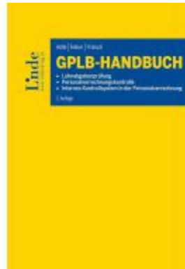
GPLB-Handbuch Ladenpreis: 66,00EUR