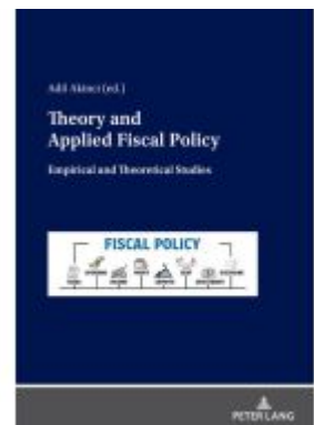
Theory and Applied Fiscal Policy Ladenpreis: 77,10EUR