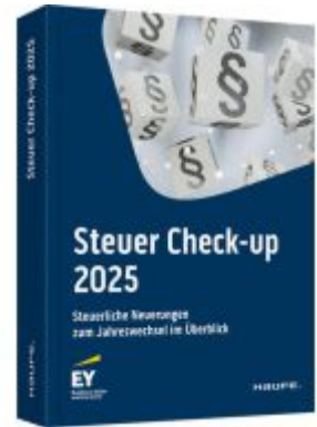
Steuer Check-up 2025 Ladenpreis: 30,70EUR