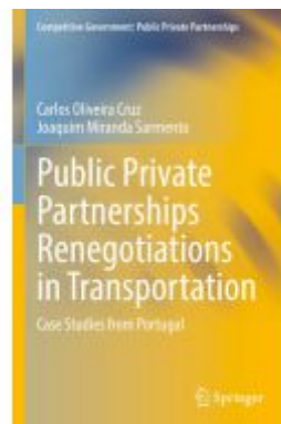
Public Private Partnerships Renegotiations in Transportation Ladenpreis: 131,99EUR