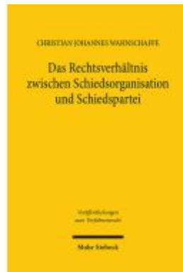
Das Rechtsverhältnis zwischen Schiedsorganisation und Schiedspartei Ladenpreis: 91,50EUR