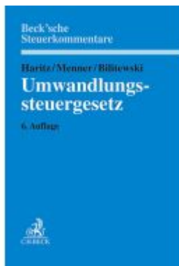
Umwandlungssteuergesetz Ladenpreis: 194,30EUR