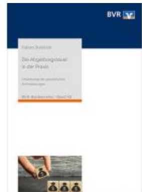
Die Abgeltungsteuer in der Praxis Ladenpreis: 50,30EUR