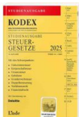
KODEX Studienausgabe Steuergesetze 2025 Ladenpreis: 19,00EUR