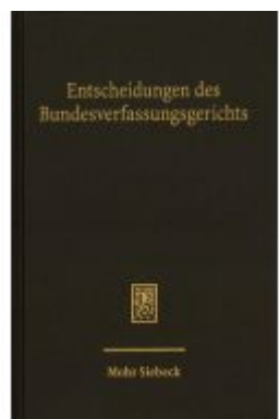
Entscheidungen des Bundesverfassungsgerichts (BVerfGE) Ladenpreis: 55,60EUR