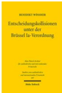
Entscheidungskollisionen unter der Brüssel Ia-Verordnung Ladenpreis: 96,70EUR