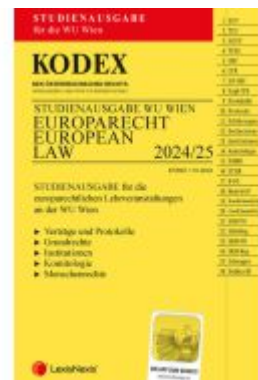
KODEX Europarecht / European Law für die WU Wien 2024/25 - inkl. App Ladenpreis: 26,00EUR