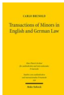
Transactions of Minors in English and German Law Ladenpreis: 81,30EUR