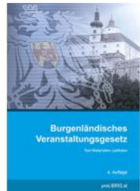
Burgenländisches Veranstaltungsgesetz Ladenpreis: 23,00EUR