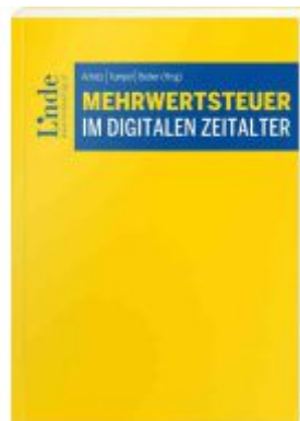
Mehrwertsteuer im digitalen Zeitalter Ladenpreis: 33,00EUR