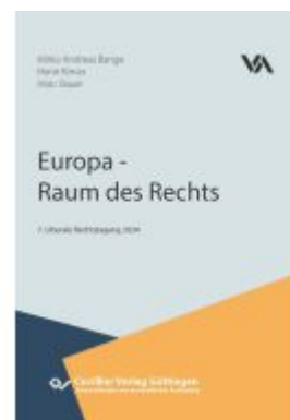
Europa - Raum des Rechts Ladenpreis: 104,70EUR