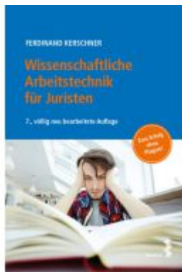
Wissenschaftliche Arbeitstechnik für Juristen Ladenpreis: 36,00EUR