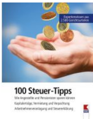
100 Steuer-Tipps Ladenpreis: 19,90 EUR