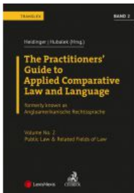
Angloamerikanische Rechtssprache / The Practitioners' Guide to Applied Comparative Law and Language Vol 2 Ladenpreis: 84,00 EUR