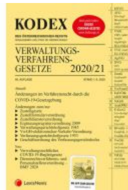
KODEX Verwaltungsverfahrensgesetze (AVG) 2020/21 Ladenpreis: 24,00 EUR