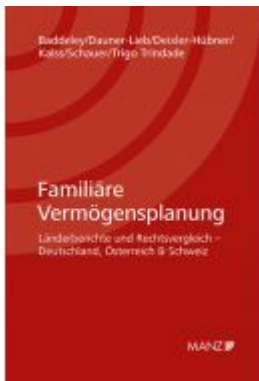
Familiäre Vermögensplanung Ladenpreis: 148,00 EUR