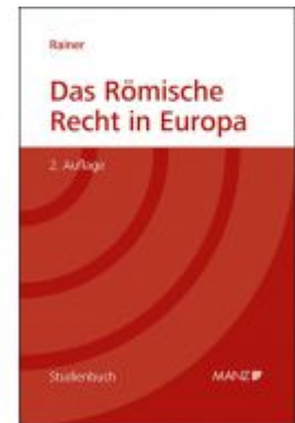
Das Römische Recht in Europa Ladenpreis: 68,00 EUR