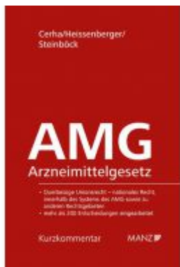
Arzneimittelgesetz Aktionspreis: 98,00 EUR Ladenpreis: 124,00 EUR