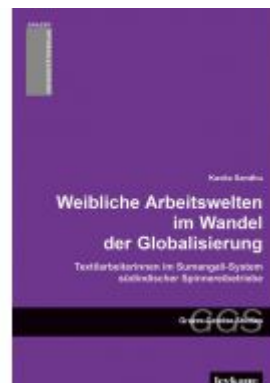
Weibliche Arbeitswelten im Wandel der Globalisierung. Textilarbeiterinnen im Sumangali-System südindischer Spinnereibetriebe. Ladenpreis: 19,90 EUR