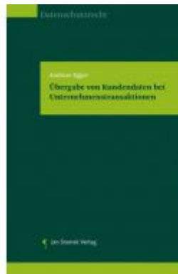
Übergabe von Kundendaten bei Unternehmenstransaktionen Ladenpreis: 37,50 EUR