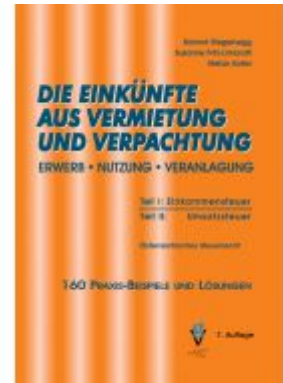
DIE EINKÜNFTE AUS VERMIETUNG UND VERPACHTUNG Ladenpreis: 66,00EUR