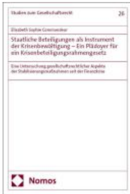
Staatliche Beteiligungen als Instrument der Krisenbewältigung – Ein Plädoyer für ein Krisenbeteiligungsrahmengesetz Ladenpreis: 86,40EUR