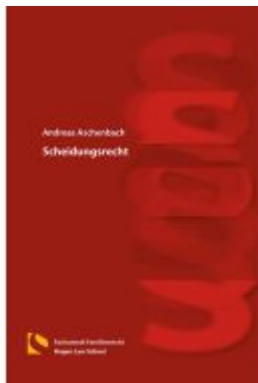
Scheidungsrecht Ladenpreis: 25,70EUR