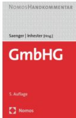
GmbHG Ladenpreis: 163,50EUR