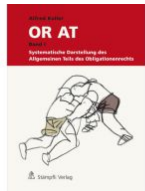
Schweizerisches Obligationenrecht Allgemeiner Teil Ladenpreis: 358,60EUR