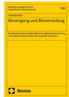
Börsengang und Börsenrückzug Ladenpreis: 112,10EUR