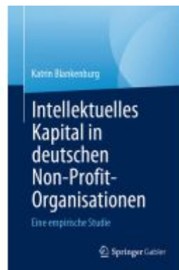
Intellektuelles Kapital in deutschen Non- Profit-Organisationen Ladenpreis: 82,23EUR