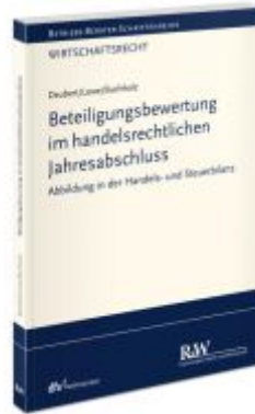
Beteiligungsbewertung im handelsrechtlichen Jahresabschluss Ladenpreis: 91,50EUR