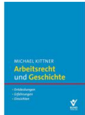
Arbeitsrecht und Geschichte Ladenpreis: 55,60EUR