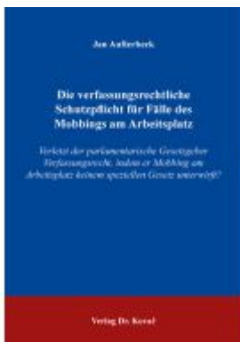
Die verfassungsrechtliche Schutzpflicht für Fälle des Mobbing am Arbeitsplatz Ladenpreis: 101,60EUR