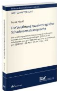
Die Verjährung quasivertraglicher Schadensersatzansprüche Ladenpreis: 91,50EUR