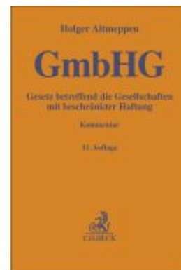
Gesetz betreffend die Gesellschaften mit beschränkter Haftung Ladenpreis: 153,20EUR