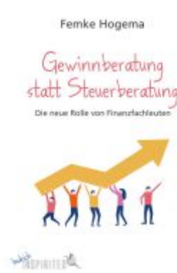
Gewinnberatung statt Steuerberatung Ladenpreis: 20,60EUR