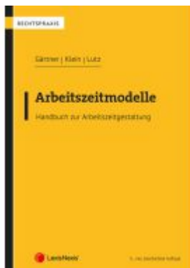
Arbeitszeitmodelle Ladenpreis: 66,00EUR