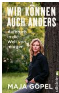
Wir können auch anders Ladenpreis: 14,40EUR