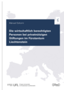
Die wirtschaftlich berechtigten Personen bei privatnützigen Stiftungen im Fürstentum Liechtenstein Ladenpreis: 49,00EUR