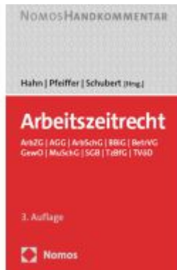
Arbeitszeitrecht Ladenpreis: 101,80EUR

Wir haben andere Produkte gefunden, die Ihnen gefallen könnten!