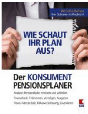
Der KONSUMENT-Pensionsplaner Ladenpreis: 19,90 EUR