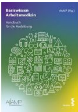
Basiswissen Arbeitsmedizin Ladenpreis: 91,50 EUR