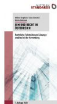
Building Information Modeling und Recht in Österreich Ladenpreis: 29,70 EUR