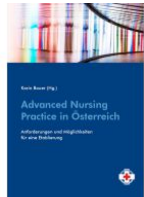
Advanced Nursing Practice in Österreich Ladenpreis: 14,90 EUR