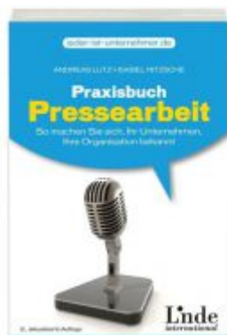
Praxisbuch Pressearbeit Ladenpreis: 18,40 EUR