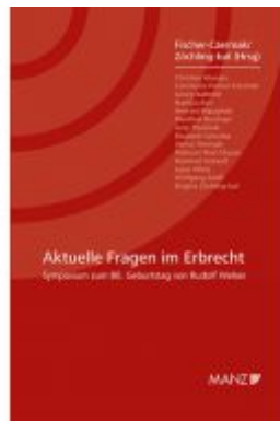
Aktuelle Fragen im Erbrecht Symposium zum 80. Geburtstag von Rudolf Welser Ladenpreis: 34,80 EUR