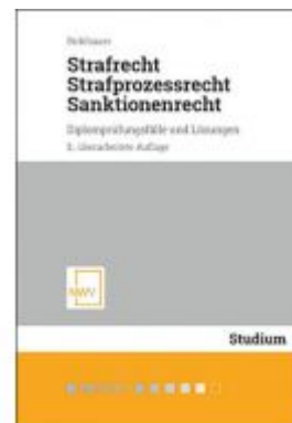
Strafrecht, Strafprozessrecht, Sanktionenrecht Ladenpreis: 32,00 EUR