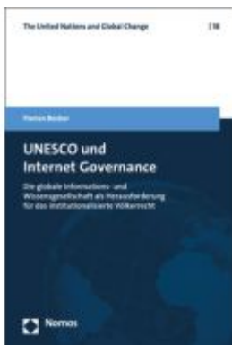
UNESCO und Internet Governance Ladenpreis: 96,70EUR