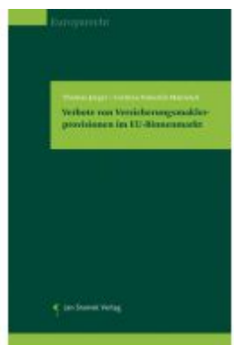
Verbote von Versicherungsmaklerprovisionen im EU- Binnenmarkt Ladenpreis: 49,90EUR