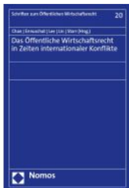
Das Öffentliche Wirtschaftsrecht in Zeiten internationaler Konflikte Ladenpreis: 65,80EUR