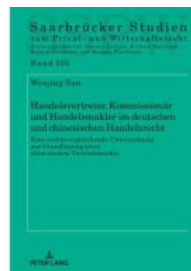
Handelsvertreter, Kommissionär und Handelsmakler im deutschen und chinesischen Handelsrecht Ladenpreis: 58,60EUR