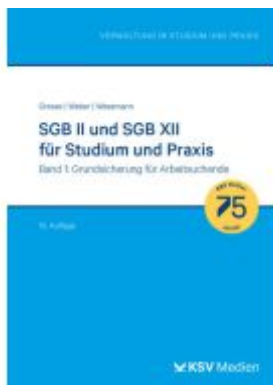
SGB II und SGB XII für Studium und Praxis (Bd. 1/3) Ladenpreis: 25,70EUR