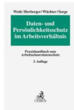
Daten- und Persönlichkeitsschutz im Arbeitsverhältnis Ladenpreis: 122,40EUR