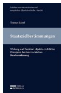
Staatszielbestimmungen Ladenpreis: 69,00EUR