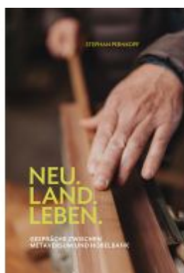
Neu.Land.Leben Ladenpreis: 25,00EUR