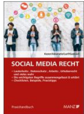
Social Media Recht Ladenpreis: 42,00EUR