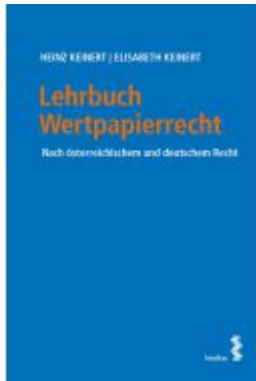
Lehrbuch Wertpapierrecht Ladenpreis: 42,00EUR