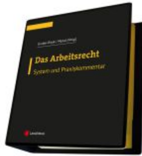
Das Arbeitsrecht - System und Praxiskommentar Ladenpreis: 348,00EUR