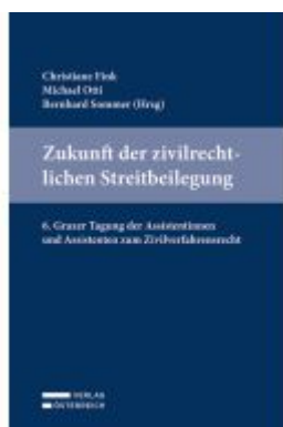
Zukunft der zivilrechtlichen Streitbeilegung Ladenpreis: 59,00EUR