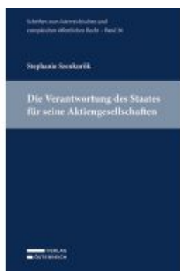
Die Verantwortung des Staates für seine Aktiengesellschaften Ladenpreis: 49,00EUR