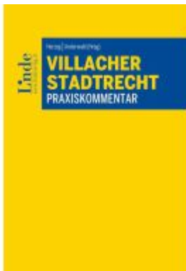
Villacher Stadtrecht Ladenpreis: 55,00EUR