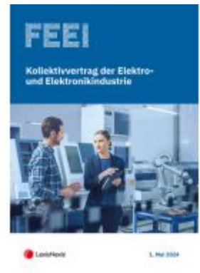
Kollektivvertrag der Elektro- und Elektronikindustrie 2024 Ladenpreis: 23,00EUR