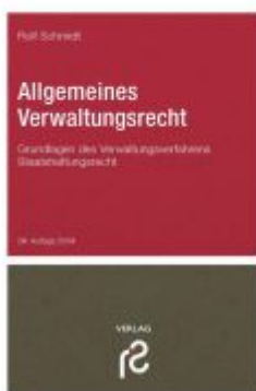
Allgemeines Verwaltungsrecht Ladenpreis: 27,60EUR