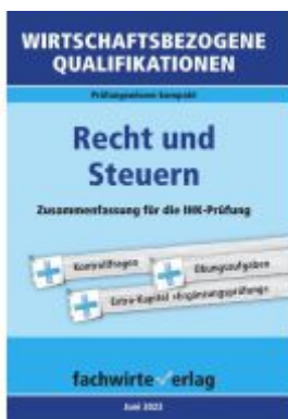
Wirtschaftsbezogene Qualifikationen: Recht und Steuern Ladenpreis: 12,40EUR