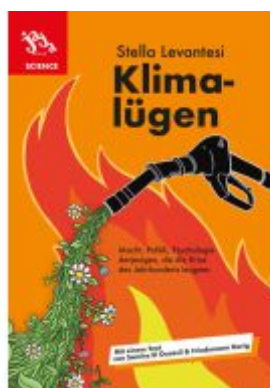
Klimalügen Ladenpreis: 20,60EUR