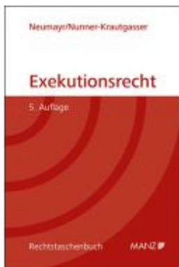
Exekutionsrecht Ladenpreis: 56,00EUR