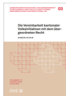
Die Vereinbarkeit kantonaler Volksinitiativen mit dem übergeordneten Recht Ladenpreis: 106,00EUR