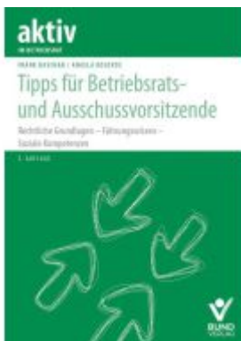
Tipps für Betriebsrats- und Ausschussvorsitzende Ladenpreis: 26,80EUR