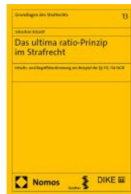
Das ultima ratio-Prinzip im Strafrecht Ladenpreis: 112,10EUR