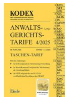
KODEX Anwalts- und Gerichtstarife 4/2025 Ladenpreis: 36,00EUR