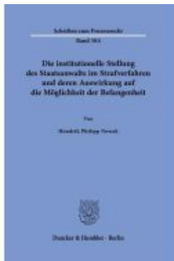
Die institutionelle Stellung des Staatsanwalts im Strafverfahren und deren Auswirkung auf die Möglichkeit der Befangenheit Ladenpreis: 71,90EUR