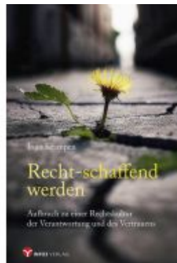
Recht-schaffend werden Ladenpreis: 16,50EUR