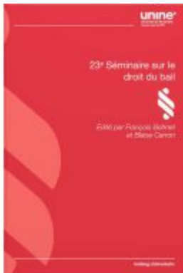
23e Séminaire sur le droit du bail Ladenpreis: 86,00EUR