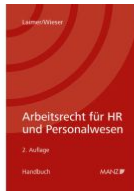
Arbeitsrecht für HR und Personalwesen Ladenpreis: 54,00EUR