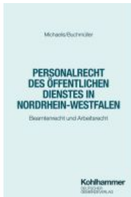
Personalrecht des Öffentlichen Dienstes in Nordrhein-Westfalen Ladenpreis: 45,30EUR