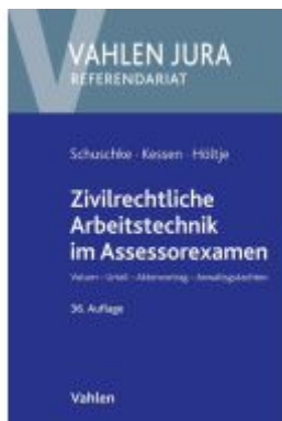
Zivilrechtliche Arbeitstechnik im Assessorexamen Ladenpreis: 41,00EUR