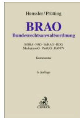
Bundesrechtsanwaltsordnung Ladenpreis: 225,20EUR