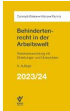
Behindertenrecht in der Arbeitswelt 2023/2024 Ladenpreis: 43,20EUR