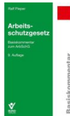
Arbeitschutzgesetz Ladenpreis: 45,30EUR