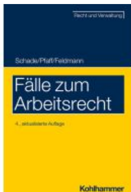
Fälle zum Arbeitsrecht Ladenpreis: 25,70EUR

Wir haben andere Produkte gefunden, die Ihnen gefallen könnten!