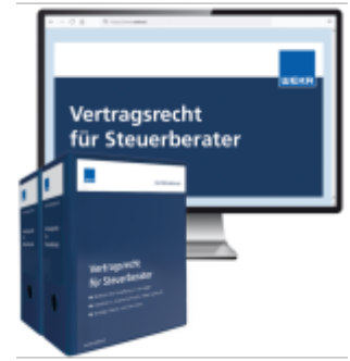
Vertragsrecht für Steuerberater Ladenpreis: 250,80EUR