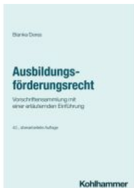
Ausbildungsförderungsrecht Ladenpreis: 70,90EUR