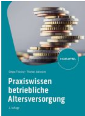
Praxiswissen Betriebliche Altersversorgung Ladenpreis: 51,40EUR