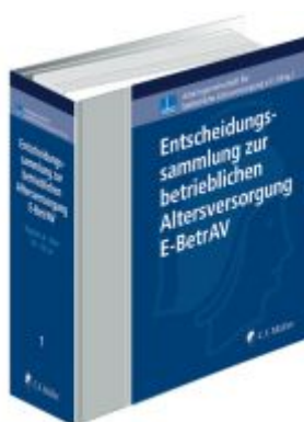
Entscheidungssammlung zur betrieblichen Altersversorgung - E-BetrAV Ladenpreis: 287,90EUR