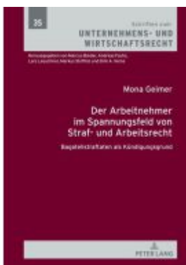
Der Arbeitnehmer im Spannungsfeld von Straf- und Arbeitsrecht Ladenpreis: 71,90EUR