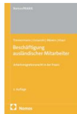
Beschäftigung ausländischer Mitarbeiter Ladenpreis: 60,70EUR