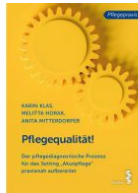
Pflegequalität! Ladenpreis: 18,90 EUR