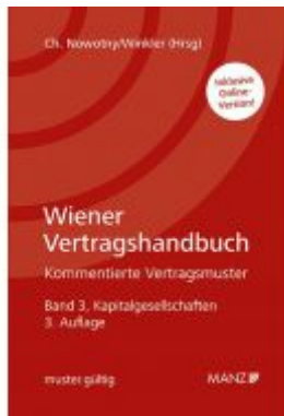
Wiener Vertragshandbuch Kapitalgesellschaften Ladenpreis: 258,00 EUR