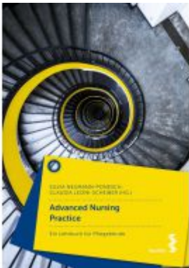
Advanced Nursing Practice Ladenpreis: 24,90 EUR