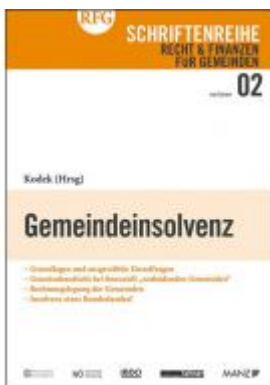
Gemeindefinsolvenz Ladenpreis: 24,00 EUR