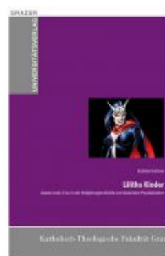
Liliths Kinder Ladenpreis: 14,90 EUR