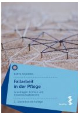
Fallarbeit in der Pflege Ladenpreis: 19,90 EUR