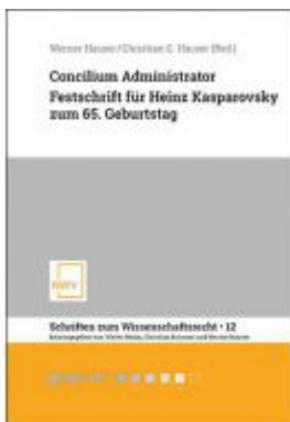
Concilium Administrator Ladenpreis: 68,00 EUR