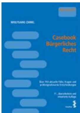
Casebook Bürgerliches Recht Ladenpreis: 48,00EUR