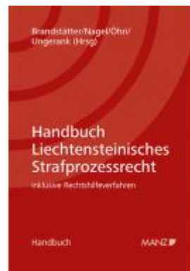
Handbuch Liechtensteinisches Strafprozessrecht Ladenpreis: 224,00EUR