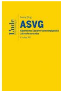
ASVG | Allgemeines Sozialversicherungsrecht 2021 Ladenpreis: 175,00EUR

Wir haben andere Produkte gefunden, die Ihnen gefallen könnten!