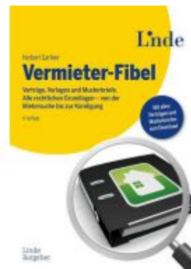
Vermieter-Fibel Ladenpreis: 32,00EUR