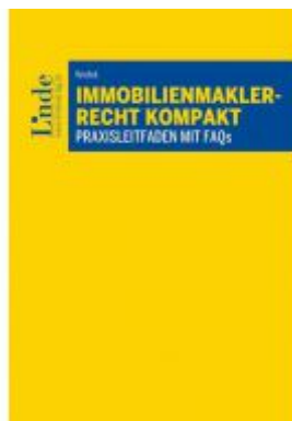
Immobilienmaklerrecht kompakt Ladenpreis: 39,00EUR