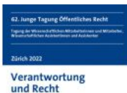
Verantwortung und Recht Ladenpreis: 50,40EUR