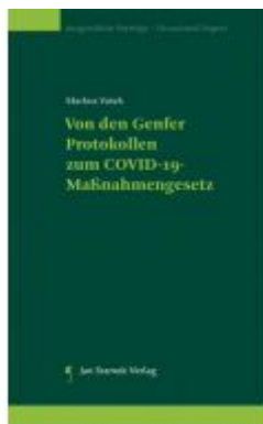
Von den Genfer Protokollen zum COVID-19-Maßnahmegesetz Ladenpreis: 39,90EUR