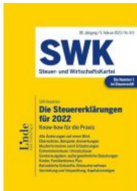
Die Steuererklärungen für 2022 Ladenpreis: 45,00EUR