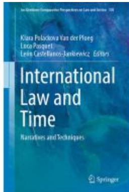
International Law and Time Ladenpreis: 175,99EUR

Wir haben andere Produkte gefunden, die Ihnen gefallen könnten!