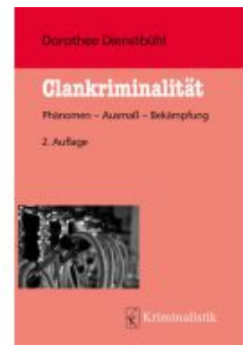
Clankriminalität Ladenpreis: 30,90EUR