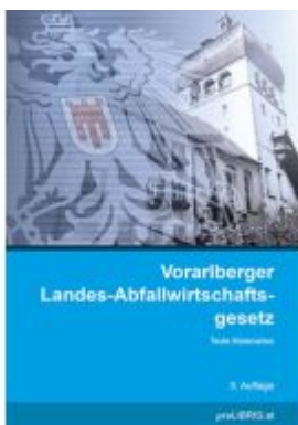
Vorarlberger Landes- Abfallwirtschaftsgesetz Ladenpreis: 21,00EUR