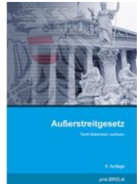
Außerstreitgesetz Ladenpreis: 36,00EUR