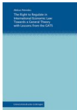
The Right to Regulate in International Economic Law Ladenpreis: 56,60EUR