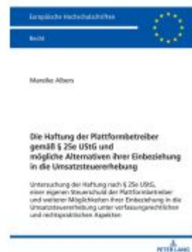
Die Haftung der Plattformbetreiber gemäß § 25e UStG und mögliche Alternativen ihrer Einbeziehung in die Umsatzsteuererhebung Ladenpreis: 87,30EUR