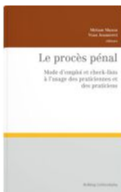
Le procès pénal Ladenpreis: 273,00EUR