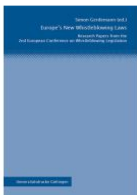
Europe's New Whistleblowing Laws Ladenpreis: 27,80EUR