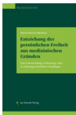
Entziehung der persönlichen Freiheit aus medizinischen Gründen Ladenpreis: 85,00EUR