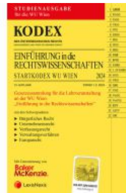
KODEX Einführung in die Rechtswissenschaften 2024 - inkl. App Ladenpreis: 12,00EUR