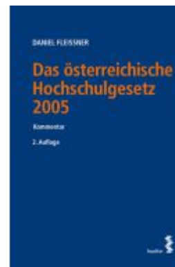
Das österreichische Hochschulgesetz 2005 Ladenpreis: 72,00EUR