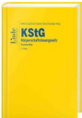
KStG | Körperschaftsteuergesetz Ladenpreis: 298,00EUR

Wir haben andere Produkte gefunden, die Ihnen gefallen könnten!