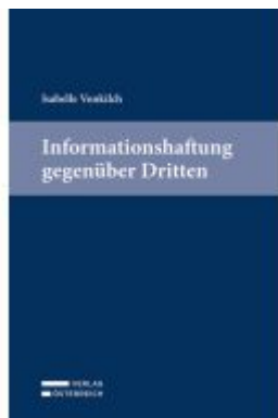
Informationshaftung gegenüber Dritten Ladenpreis: 79,00EUR