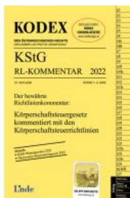
KODEX KStG Richtlinien-Kommentar 2022 Ladenpreis: 51,00EUR