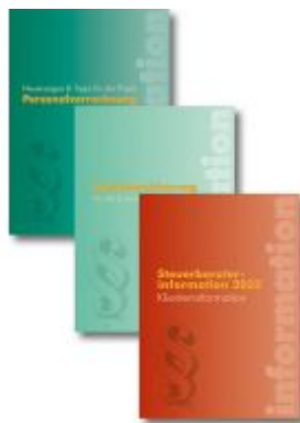
Steuerrechts-Paket 2023 Ladenpreis: 119,90EUR