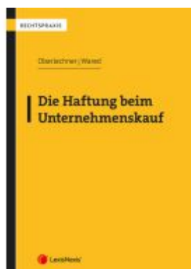
Die Haftung beim Unternehmenskauf Ladenpreis: 57,00EUR