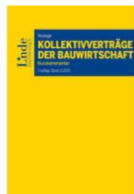
Kollektivverträge der Bauwirtschaft Ladenpreis: 78,00EUR