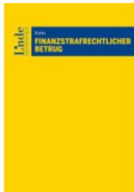
Finanzstrafrechtlicher Betrug Ladenpreis: 59,00EUR