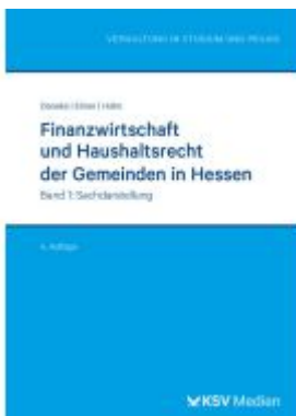
Finanzwirtschaft und Haushaltsrecht der Gemeinden in Hessen Ladenpreis: 46,30EUR