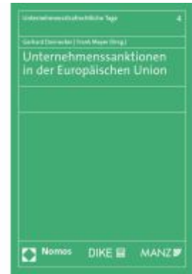
Unternehmenssanktionen in der Europäischen Union Ladenpreis: 65,80EUR