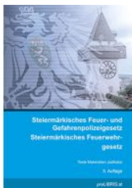
Steiermärkisches Feuer- und Gefahrenpolizeigesetz / Steiermärkisches Feuerwehrgesetz Ladenpreis: 25,00EUR