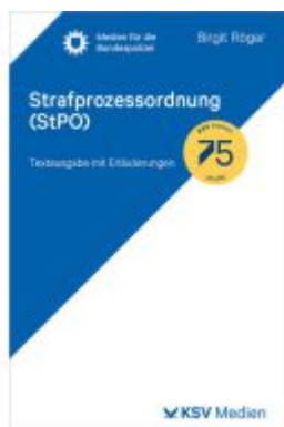
Strafprozessordnung (StPO) Ladenpreis: 41,20EUR