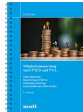
Tätigkeitsbewertung nach TVöD und TV-L Ladenpreis: 50,40EUR