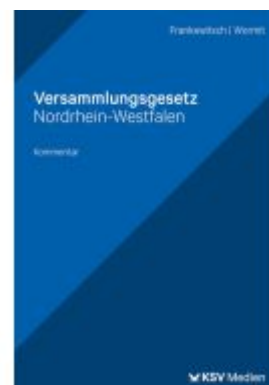
Versammlungsgesetz Nordrhein-Westfalen Ladenpreis: 35,00EUR