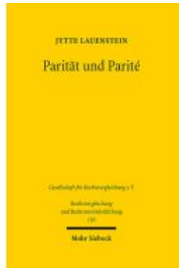
Parität und Parité Ladenpreis: 86,40EUR