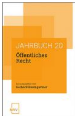
Öffentliches Recht Ladenpreis: 68,00 EUR

Wir haben andere Produkte gefunden, die Ihnen gefallen könnten!