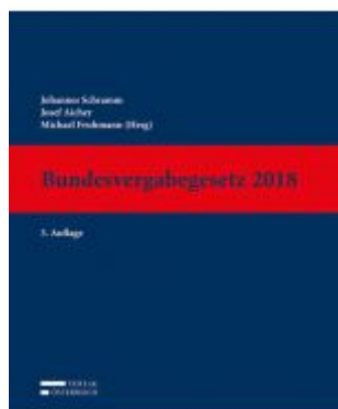
Bundesvergabegesetz 2018 Ladenpreis: 899,00 EUR