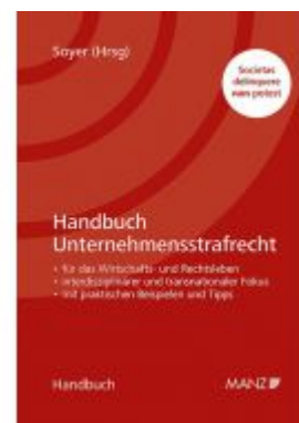
Handbuch Unternehmensstrafrecht Ladenpreis: 118,00 EUR