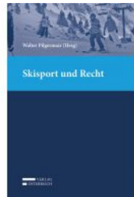
Skisport und Recht Ladenpreis: 75,00 EUR