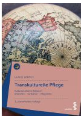
Transkulturelle Pflege Ladenpreis: 24,90 EUR