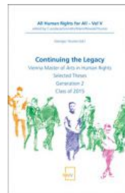
Continuing the Legacy Ladenpreis: 58,00 EUR