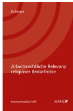
Arbeitsrechtliche Relevanz religiöser Bedürfnisse Ladenpreis: 74,00 EUR