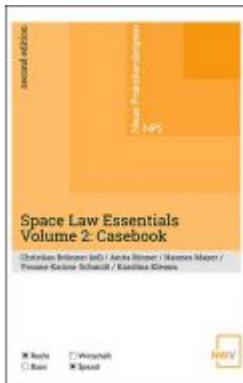
Space Law Essentials Ladenpreis: 19,00 EUR