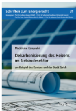
Dekarbonisierung des Heizens im Gebäudesektor Ladenpreis: 48,00EUR