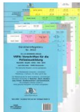
DürckheimRegister® VSPA Wichtige Gesetze für die Polizeiausbildung OHNE Stichworte Ladenpreis: 25,00EUR