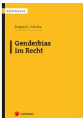
Genderbias im Recht Ladenpreis: 39,00EUR