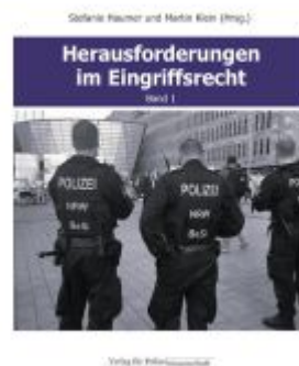
Herausforderungen im Eingriffsrecht Ladenpreis: 29,80EUR