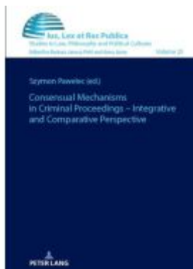
Consensual Mechanisms in Criminal Proceedings – Integrative and Comparative Perspective Ladenpreis: 61,60EUR