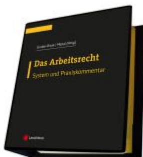
Das Arbeitsrecht - System und Praxiskommentar Ladenpreis: 409,00EUR