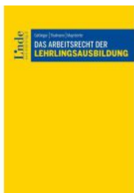
Das Arbeitsrecht der Lehrlingsausbildung Ladenpreis: 79,00EUR