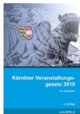
Kärntner Veranstaltungsgesetz 2010 Ladenpreis: 23,00EUR