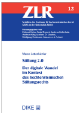
Stiftung 2.0 Der digitale Wandel im Kontext des liechtensteinischen Stiftungsrechts Ladenpreis: 52,00EUR

Wir haben andere Produkte gefunden, die Ihnen gefallen könnten!