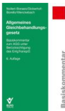
Allgemeines Gleichbehandlungsgesetz Ladenpreis: 45,30EUR