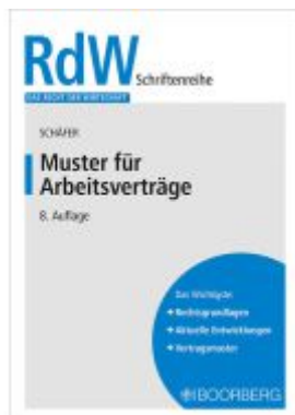
Muster für Arbeitsverträge Ladenpreis: 14,40EUR