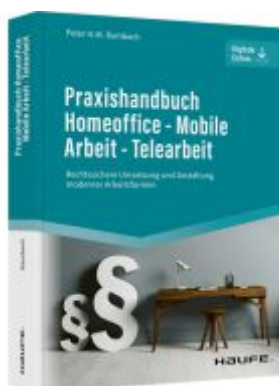
Praxishandbuch Homeoffice - Mobile Arbeit - Telearbeit Ladenpreis: 61,70EUR