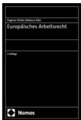
Europäisches Arbeitsrecht Ladenpreis: 50,40EUR