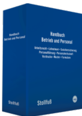
Handbuch Betrieb und Personal Ladenpreis: 164,50EUR