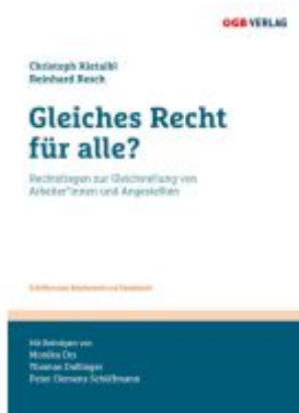
Gleiches Recht für alle? Ladenpreis: 29,90EUR