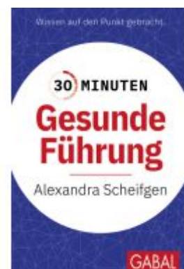
30 Minuten Gesunde Führung Ladenpreis: 11,30EUR