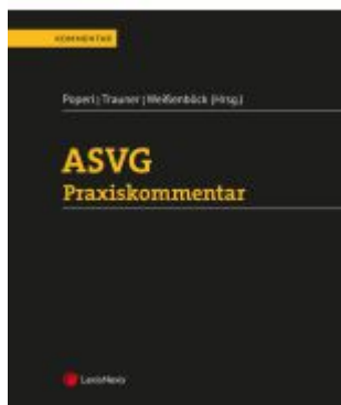
ASVG Praxiskommentar Ladenpreis: 432,00EUR