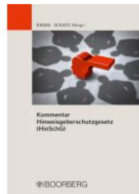
Kommentar Hinweisgeberschutzgesetz (HinSchG) Ladenpreis: 91,50EUR