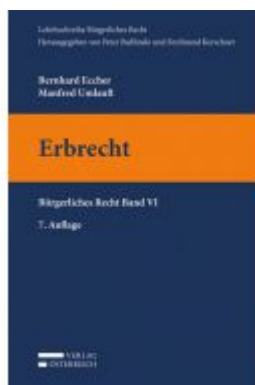
Erbrecht Ladenpreis: 28,00 EUR