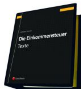
Die Einkommensteuer (EStG 1988) Band I - Texte Ladenpreis: 287,00 EUR