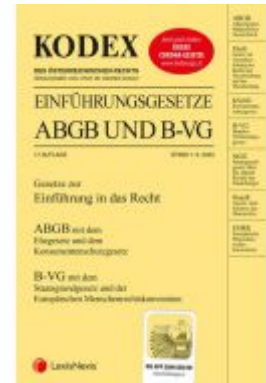
KODEX Einführungsgesetze ABGB und B- VG 2020/21 Ladenpreis: 15,00 EUR