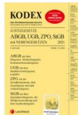
KODEX Justizgesetze 2021 Ladenpreis: 29,00 EUR