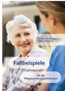
Fallbeispiele Ladenpreis: 19,90 EUR