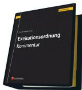
Exekutionsordnung - Kommentar Ladenpreis: 623,00 EUR