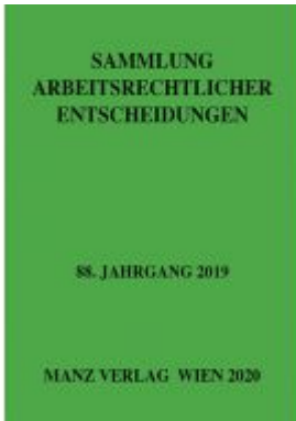
Sammlung arbeitsrechtlicher Entscheidungen Ladenpreis: 96,00 EUR