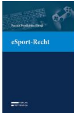
eSport-Recht Ladenpreis: 79,00EUR