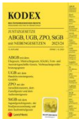
KODEX Justizgesetze 2023/24 - inkl. App Ladenpreis: 34,00EUR