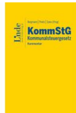
KommStG | Kommunalsteuergesetz Aktionspreis: 120,00EUR Ladenpreis: 150,00EUR