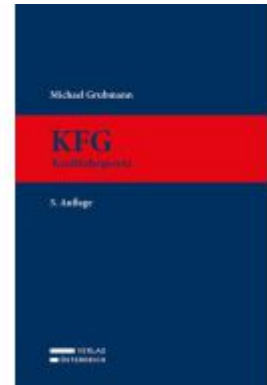
KFG Ladenpreis: 399,00EUR