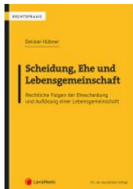
Scheidung, Ehe und Lebensgemeinschaft Ladenpreis: 79,00EUR