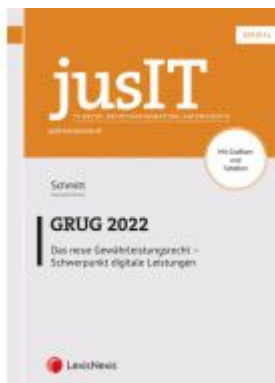
jusIT Spezial: GRUG 2022 Ladenpreis: 29,00EUR

Wir haben andere Produkte gefunden, die Ihnen gefallen könnten!