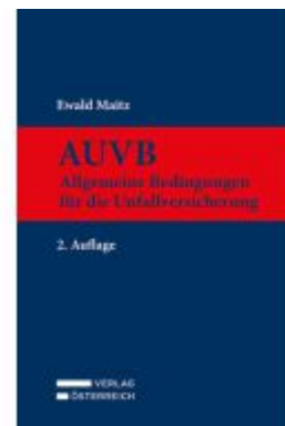
AUVB Ladenpreis: 169,00EUR