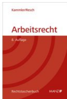
Arbeitsrecht Ladenpreis: 54,30EUR