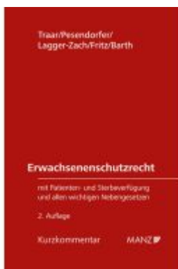
Erwachsenenschutzrecht Ladenpreis: 148,00EUR