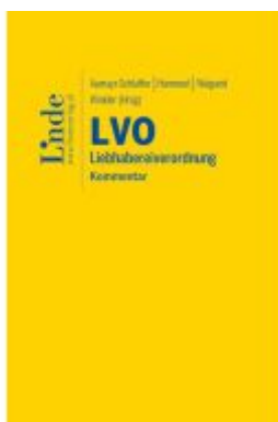
LVO | Liebhabereiverordnung Ladenpreis: 79,00EUR