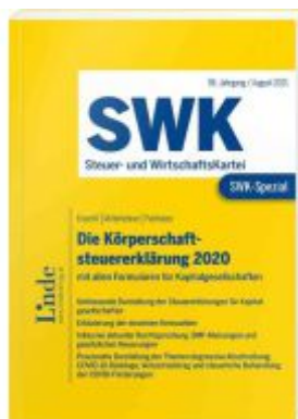
SWK-Spezial Die Körperschaftsteuererklärung 2020 Ladenpreis: 48,00EUR