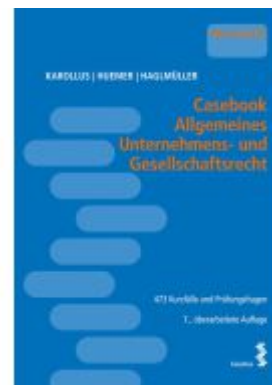
Casebook Allgemeines Unternehmens- und Gesellschaftsrecht Ladenpreis: 40,00EUR