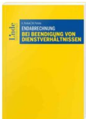
Endabrechnung bei Beendigung von Dienstverhältnissen Ladenpreis: 28,00EUR