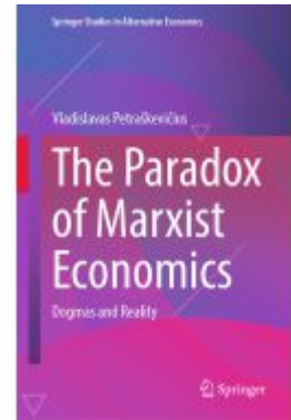
The Paradox of Marxist Economics Ladenpreis: 131,99EUR