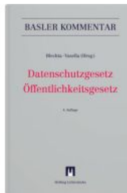
Datenschutzgesetz/Öffentlichkeitsgesetz Ladenpreis: 471,00EUR