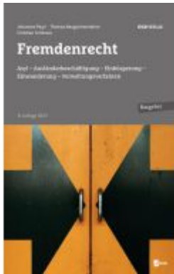
Fremdenrecht Ladenpreis: 39,00EUR