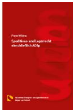
Speditions- und Lagerrecht einschließlich ADSp Ladenpreis: 36,00EUR