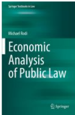
Economic Analysis of Public Law Ladenpreis: 109,99EUR