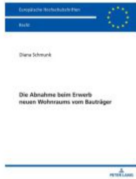
Die Abnahme beim Erwerb neuen Wohnraums vom Bauträger Ladenpreis: 61,05EUR