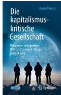
Die kapitalismuskritische Gesellschaft Ladenpreis: 23,63EUR