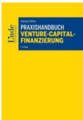
Praxishandbuch Venture-Capital- Finanzierung Ladenpreis: 59,00EUR