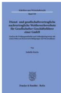
Dienst- und gesellschaftsvertragliche nachvertragliche Wettbewerbsverbote für Gesellschafter-Geschäftsführer einer GmbH. Ladenpreis: 92,50EUR