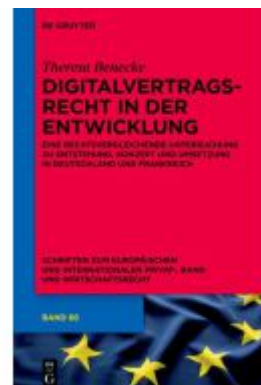
Digitalvertragsrecht in der Entwicklung Ladenpreis: 119,95EUR