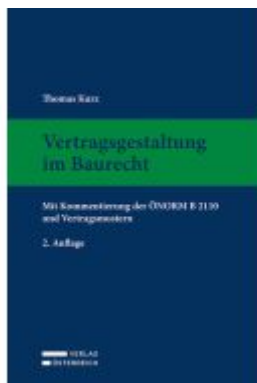
Vertragsgestaltung im Baurecht Ladenpreis: 159,00EUR