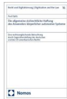
Die allgemeine zivilrechtliche Haftung des Anwenders körperlicher autonomer Systeme Ladenpreis: 122,40EUR