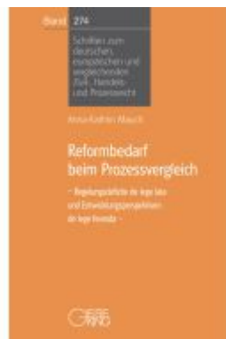
Reformbedarf beim Prozessvergleich Ladenpreis: 100,80EUR