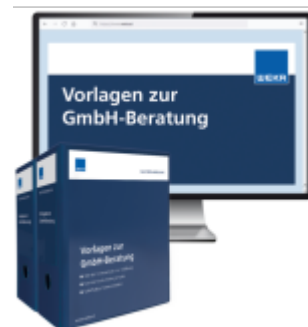
Vorlagen zur GmbH-Beratung Ladenpreis: 261,80EUR