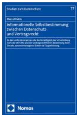
Informationelle Selbstbestimmung zwischen Datenschutz- und Vertragsrecht Ladenpreis: 76,10EUR