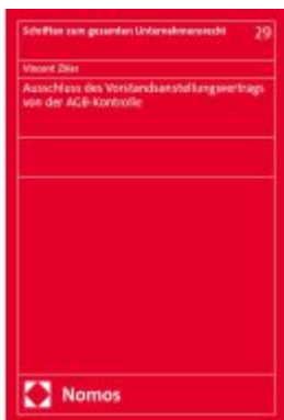
Ausschluss des Vorstandsanstellungsvertrags von der AGB-Kontrolle Ladenpreis: 91,50EUR