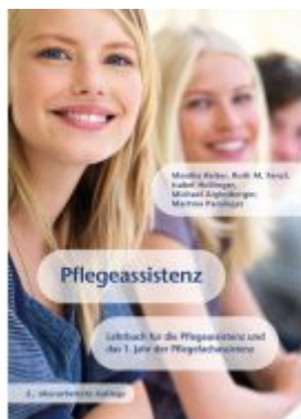
Pflegeassistenz Ladenpreis: 49,90 EUR