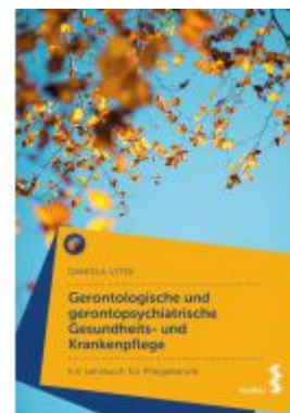
Gerontologische und gerontopsychiatrische Gesundheits- und Krankenpflege Ladenpreis: 22,90 EUR