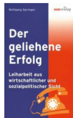
Der geliehene Erfolg Ladenpreis: 19,90 EUR