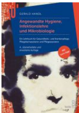
Angewandte Hygiene Ladenpreis: 29,90 EUR