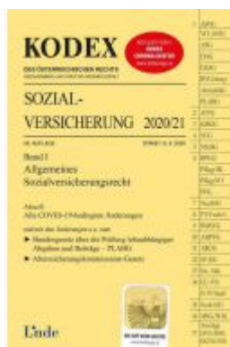
KODEX Sozialversicherung 2020/21, Band I Ladenpreis: 41,00 EUR