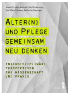
Alter(n) und Pflege gemeinsam neu denken Ladenpreis: 19,90 EUR

Wir haben andere Produkte gefunden, die Ihnen gefallen könnten!