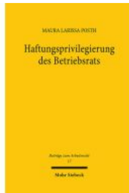
Haftungsprivilegierung des Betriebsrats Ladenpreis: 96,70EUR