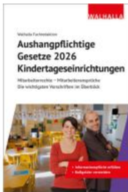
Aushangpflichtige Gesetze 2026 Kindertageseinrichtungen Ladenpreis: 15,00EUR