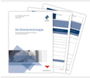
Die Brandschutzmappe Ladenpreis: 116,63EUR