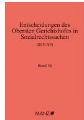
Entscheidungen des obersten Gerichtshofes in Sozialrechtssachen SSV- NF Ladenpreis: 318,50EUR