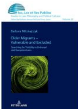
Older Migrants – Vulnerable and Excluded Ladenpreis: 51,40EUR