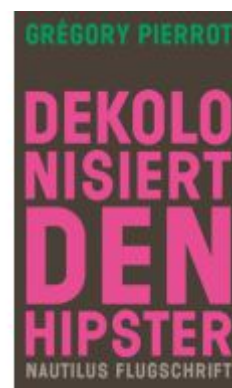
Dekolonisiert den Hipster Ladenpreis: 18,50EUR