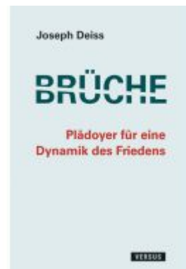
Brüche - Plädoyer für eine Dynamik des Friedens Ladenpreis: 29,80EUR