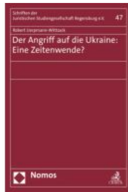
Der Angriff auf die Ukraine: Eine Zeitenwende?