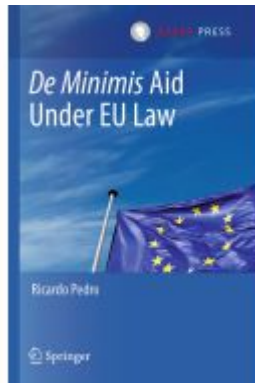
De Minimis Aid Under EU Law