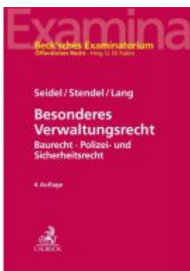
Besonderes Verwaltungsrecht Ladenpreis: 35,90EUR