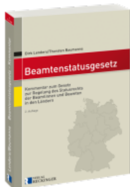
Beamtenstatusgesetz Ladenpreis: 60,70EUR

Wir haben andere Produkte gefunden, die Ihnen gefallen könnten!