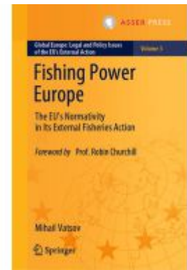
Fishing Power Europe