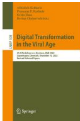
Digital Transformation in the Viral Age