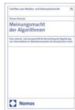
Meinungsmacht der Algorithmen Ladenpreis: 101,80EUR