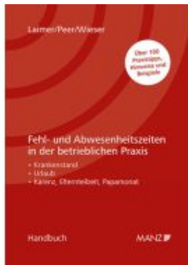
Fehl- und Abwesenheitszeiten in der betrieblichen Praxis Ladenpreis: 52,00EUR