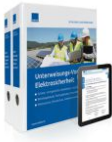
Unterweisungs-Vorlagen Elektrosicherheit Ladenpreis: 239,80EUR