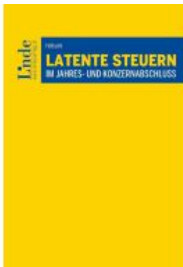
Latente Steuern im Jahres- und Konzernabschluss Ladenpreis: 66,00EUR