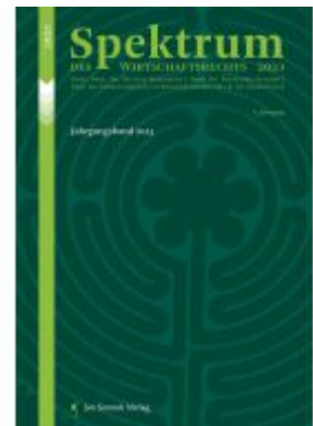
Spektrum des Wirtschaftsrechts Ladenpreis: 42,50EUR