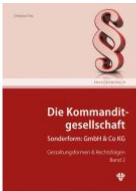
Die Kommanditgesellschaft Band 2 Ladenpreis: 52,00EUR

Wir haben andere Produkte gefunden, die Ihnen gefallen könnten!