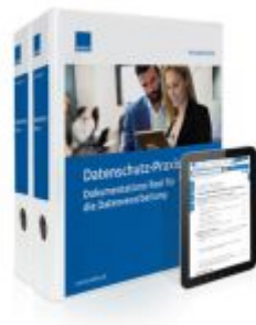
Datenschutz-Praxis Ladenpreis: 239,80EUR