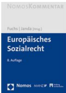
Europäisches Sozialrecht Ladenpreis: 162,40EUR