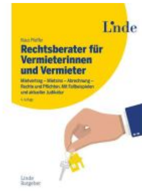
Rechtsberater für Vermieterinnen und Vermieter Ladenpreis: 29,90EUR