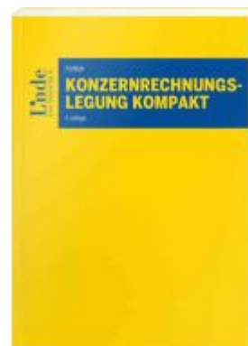
Konzernrechnungslegung kompakt Ladenpreis: 70,00EUR