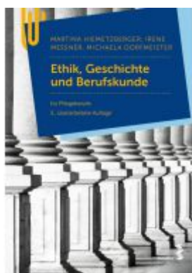
Ethik, Geschichte und Berufskunde Ladenpreis: 26,90 EUR