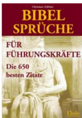
Bibelsprüche für Führungskräfte Ladenpreis: 18,50 EUR