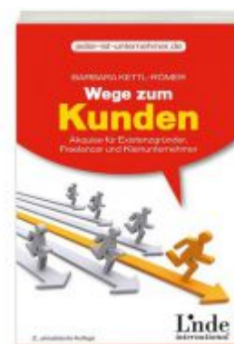
Wege zum Kunden Ladenpreis: 19,90 EUR