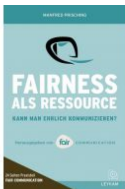
Fairness als Ressource Ladenpreis: 17,90 EUR