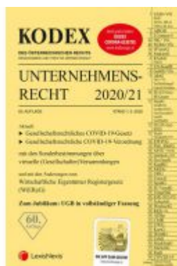
KODEX Unternehmensrecht 2020/21 Ladenpreis: 37,50 EUR