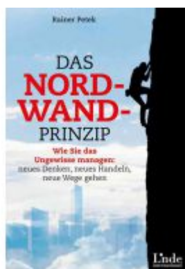
Das Nordwand-Prinzip Ladenpreis: 19,90 EUR