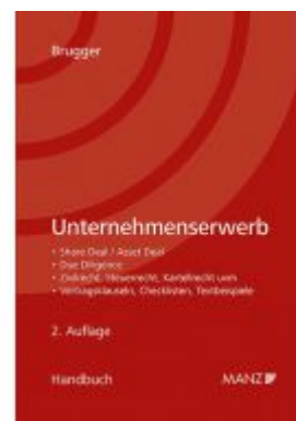
Handbuch Unternehmenserwerb Ladenpreis: 158,00 EUR