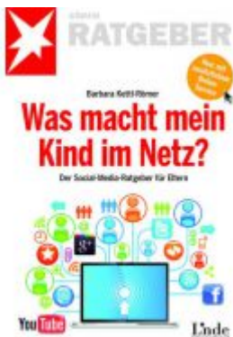
Was macht mein Kind im Netz? Ladenpreis: 9,90 EUR

Wir haben andere Produkte gefunden, die Ihnen gefallen könnten!