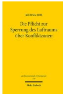
Die Pflicht zur Sperrung des Luftraums über Konfliktzonen Ladenpreis: 81,30EUR