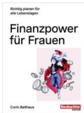
Finanzpower für Frauen Ladenpreis: 39,00EUR