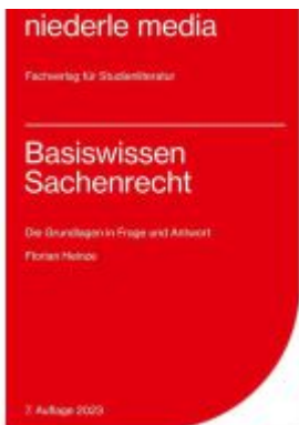
Basiswissen Sachenrecht - 2023 Ladenpreis: 12,30EUR

Wir haben andere Produkte gefunden, die Ihnen gefallen könnten!