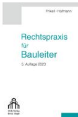
Rechtspraxis für Bauleiter Ladenpreis: 39,70EUR