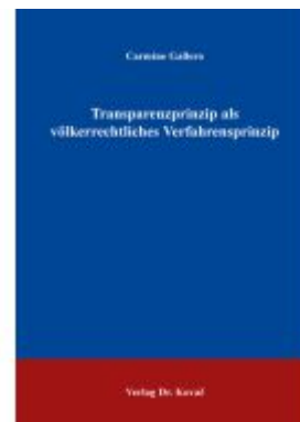
Transparenzprinzip als völkerrechtliches Verfahrensprinzip Ladenpreis: 102,60EUR