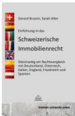
Einführung in das Schweizerische Immobilienrecht Ladenpreis: 28,80EUR