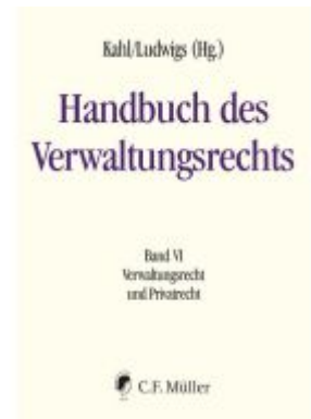
Handbuch des Verwaltungsrechts Ladenpreis: 287,90EUR