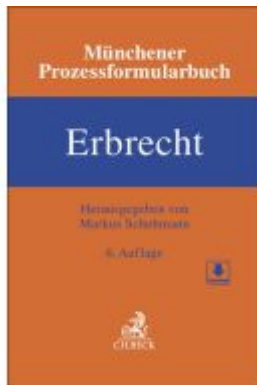
Münchener Prozessformularbuch Bd. 4: Erbrecht Ladenpreis: 225,20EUR