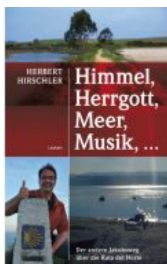
Himmel, Herrgott, Meer, Musik, ... Ladenpreis: 21,00 EUR