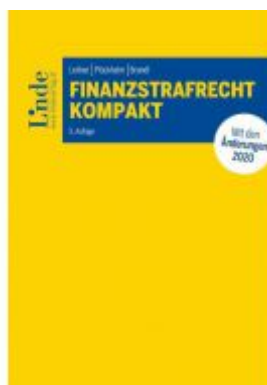
Finanzstrafrecht kompakt Ladenpreis: 48,00 EUR