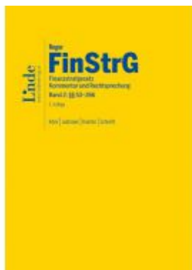
FinStrG | Finanzstrafgesetz Ladenpreis: 220,00 EUR