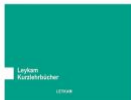
Gesetzeskunde für Pharmazeutinnen und Pharmazeuten 2. Auflage Ladenpreis: 26,50 EUR

Beatrix Dornemann Gesetzeskunde für Pharmazeutinnen und Pharmazeuten 2. Auflage