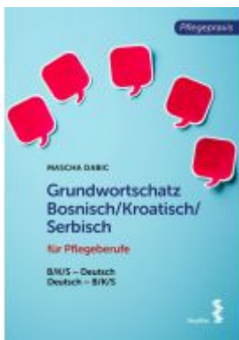
Grundwortschatz Bosnisch/Kroatisch/Serbisch für Pflegeberufe Ladenpreis: 18,90 EUR

Beatrix Dornemann Gesetzeskunde für Pharmazeutinnen und Pharmazeuten 2. Auflage