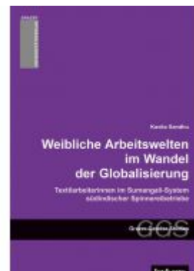
Weibliche Arbeitswelten im Wandel der Globalisierung. Textilarbeiterinnen im Sumangali-System südindischer Spinnereibetriebe. Ladenpreis: 19,90 EUR