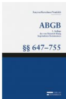
Großkommentar zum ABGB - Klang Kommentar Ladenpreis: 245,00 EUR