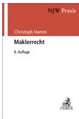
Maklerrecht Ladenpreis: 66,90EUR