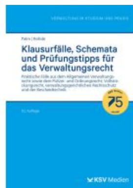
Klausurfälle, Schemata und Prüfungstipps für das Verwaltungsrecht Ladenpreis: 25,70EUR