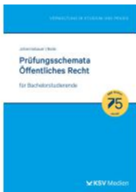
Prüfungsschemata Öffentliches Recht