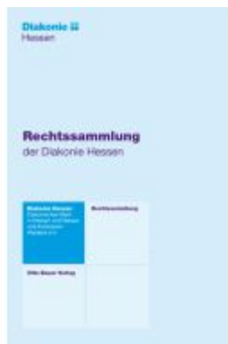
Rechtssammlung der Diakonie Hessen