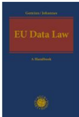
EU Data Law Ladenpreis: 195,40EUR