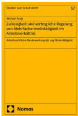
Zulässigkeit und vertragliche Regelung von Mehrfacherwerbstätigkeit im Arbeitsverhältnis Ladenpreis: 117,20EUR