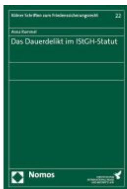
Das Dauerdelikt im IstGH-Statut Ladenpreis: 81,30EUR