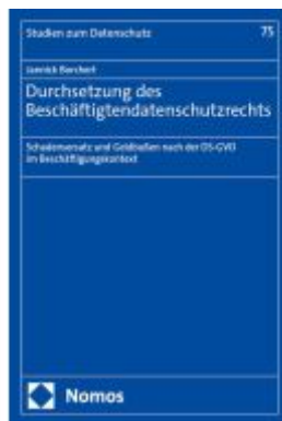
Durchsetzung des Beschäftigtendatenschutzrechts