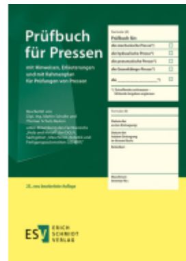
Prüfbuch für Pressen Ladenpreis: 12,30EUR