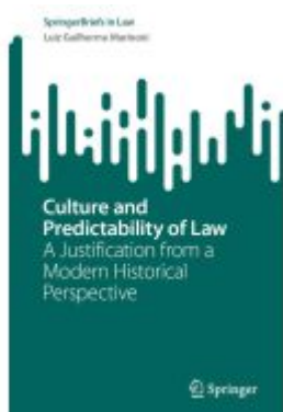
Culture and Predictability of Law Ladenpreis: 54,99EUR