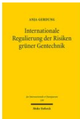
Internationale Regulierung der Risiken grüner Gentechnik Ladenpreis: 122,40EUR