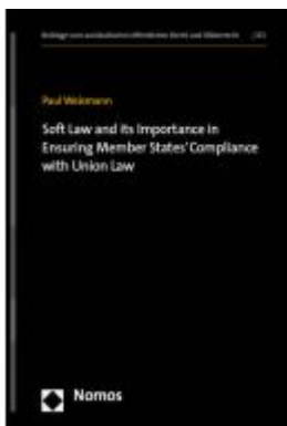
Soft Law and its Importance in Ensuring Member States' Compliance with Union Law Ladenpreis: 225,20EUR