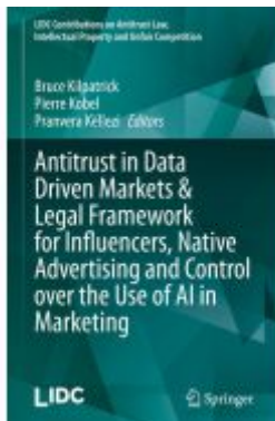
Antitrust in Data Driven Markets & Legal Framework for Influencers, Native Advertising and Control over the Use of AI in Marketing Ladenpreis: 274,99EUR