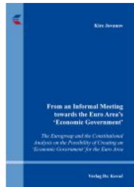
From an Informal Meeting towards the Euro Area's 'Economic Government' Ladenpreis: 91,40EUR