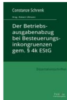
Der Betriebsausgabenabzug bei Besteuerungsinkongruenzen gem. § 4k EStG Ladenpreis: 89,90EUR