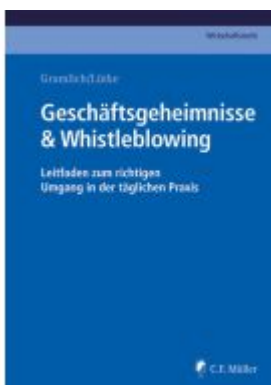
Geschäftsgeheimnisse & Whistleblowing Ladenpreis: 40,10EUR