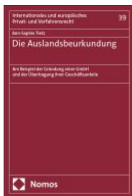
Die Auslandsbeurkundung Ladenpreis: 107,00EUR