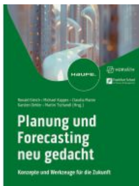
Planung und Forecasting neu gedacht Ladenpreis: 92,60EUR