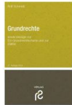
Grundrechte Ladenpreis: 27,60EUR