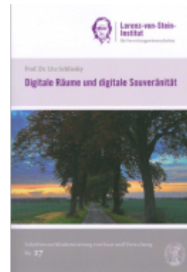
Digitale Räume und digitale Souveränität Ladenpreis: 13,30EUR