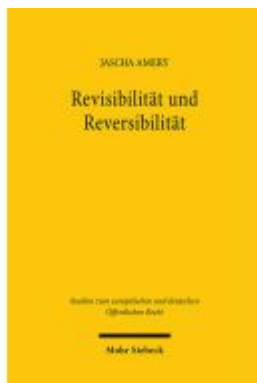
Revisibilität und Reversibilität Ladenpreis: 97,70EUR