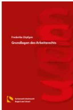
Grundlagen des Arbeitsrechts Ladenpreis: 25,70EUR