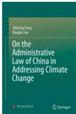
On the Administrative Law of China in Addressing Climate Change Ladenpreis: 175,99EUR