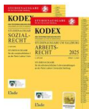
KODEX-Paket Studienausgabe Arbeits- und Sozialrecht Salzburg 2025 Ladenpreis: 22,00EUR