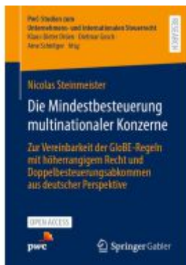
Die Mindestbesteuerung multinationaler Konzerne Ladenpreis: 43,99EUR