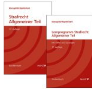
PAKET: Grundriss des Strafrechts 17. Aufl BR + Lernprogramm 17. Aufl Allgemeiner Teil Ladenpreis: 105,20EUR