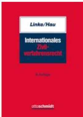
Internationales Zivilverfahrensrecht Ladenpreis: 51,20EUR

Wir haben andere Produkte gefunden, die Ihnen gefallen könnten!