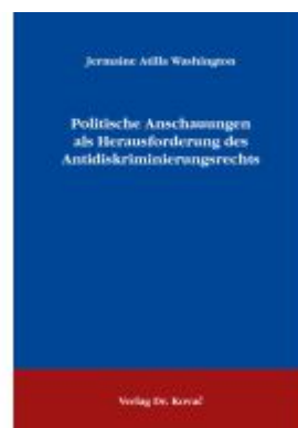
Politische Anschauungen als Herausforderung des Antidiskriminierungsrechts Ladenpreis: 101,60EUR