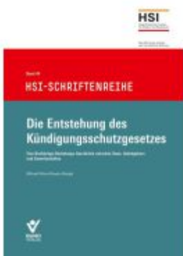
Die Entstehung des Kündigungsschutzgesetzes Ladenpreis: 37,10EUR