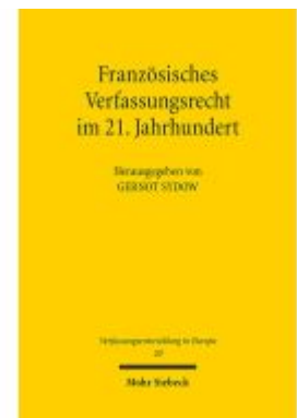
Französisches Verfassungsrecht im 21. Jahrhundert Ladenpreis: 91,50EUR