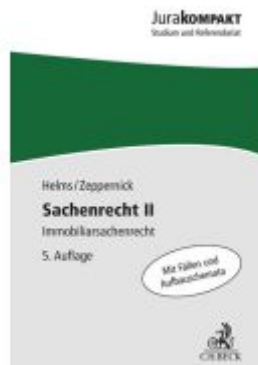
Sachenrecht II Ladenpreis: 13,30EUR