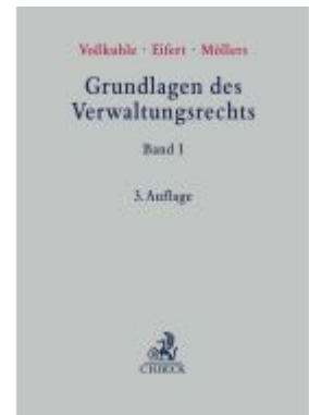
Grundlagen des Verwaltungsrechts Band I Ladenpreis: 256,50EUR