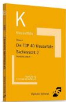
Die TOP 40 Klausurfälle Sachenrecht 2 Ladenpreis: 13,30EUR