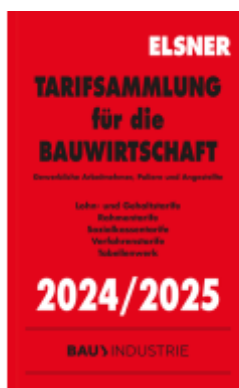
Tarifsammlung für die Bauwirtschaft 2024/2025 Ladenpreis: 61,30EUR