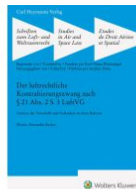
Der luftrechtliche Kontrahierungszwang nach § 21 Abs. 2 S. 3 LuftVG (SLW 47) Ladenpreis: 74,10EUR