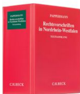
Rechtsvorschriften in Nordrhein-Westfalen Ladenpreis: 50,40EUR