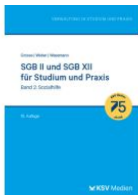
SGB II und SGB XII für Studium und Praxis (Bd. 2/3) Ladenpreis: 36,00EUR