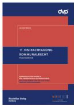
11. NSI-Fachtagung Kommunalrecht Ladenpreis: 25,70EUR