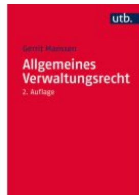
Allgemeines Verwaltungsrecht Ladenpreis: 17,40EUR