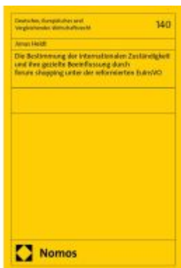
Die Bestimmung der internationalen Zuständigkeit und ihre gezielte Beeinflussung durch forum shopping unter der reformierten EuInsVO Ladenpreis: 204,60EUR