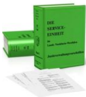
Die Service-Einheit im Lande Nordrhein-Westfalen Ladenpreis: 133,70EUR