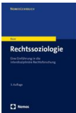
Rechtssoziologie Ladenpreis: 27,70EUR