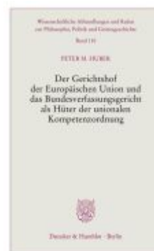
Der Gerichtshof der Europäischen Union und das Bundesverfassungsgericht als Hüter der unionalen Kompetenzordnung. Ladenpreis: 20,50EUR