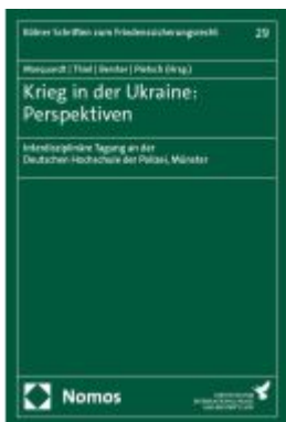
Krieg in der Ukraine: Perspektiven Ladenpreis: 76,10EUR

Wir haben andere Produkte gefunden, die Ihnen gefallen könnten!