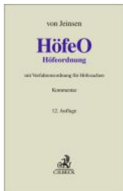
Höfeordnung Ladenpreis: 132,70EUR