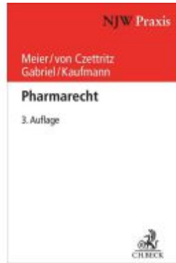
Pharmarecht Ladenpreis: 122,40EUR