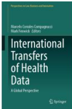
International Transfers of Health Data Ladenpreis: 186,99EUR