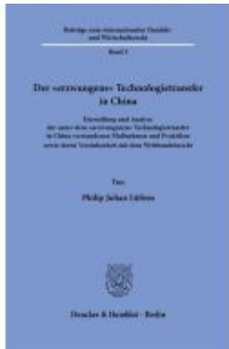
Der "erzwungene" Technologietransfer in China Ladenpreis: 102,70EUR