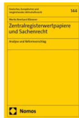
Zentralregisterwertpapiere und Sachenrecht Ladenpreis: 122,40EUR