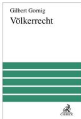
Völkerrecht Ladenpreis: 163,50EUR