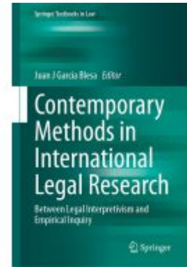
Contemporary Methods in International Legal Research Ladenpreis: 93,49EUR