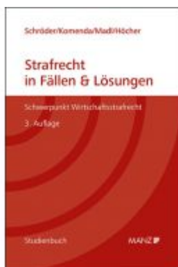
Strafrecht in Fällen & Lösungen Schwerpunkt Wirtschaftsstrafrecht Ladenpreis: 34,40 EUR