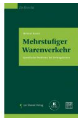
Mehrstufiger Warenverkehr Ladenpreis: 68,00 EUR