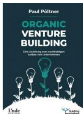
Organic Venture Building Ladenpreis: 38,00 EUR