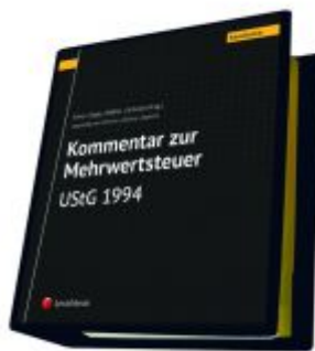
Kommentar zur Mehrwertsteuer - UStG 1994 Ladenpreis: 750,00 EUR