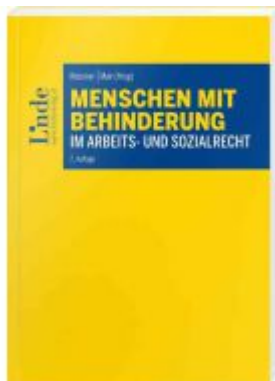
Menschen mit Behinderung im Arbeits- und Sozialrecht Ladenpreis: 35,00 EUR