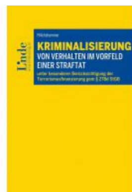
Kriminalisierung von Verhalten im Vorfeld einer Straftat Ladenpreis: 39,00 EUR