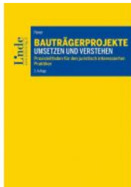
Bauträgerprojekte umsetzen und verstehen Ladenpreis: 52,00 EUR