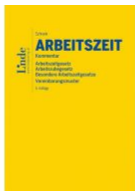
AZG | Arbeitszeitgesetz Ladenpreis: 218,00 EUR