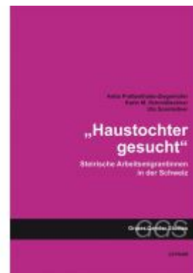
"Haustochter gesucht" Ladenpreis: 19,90 EUR