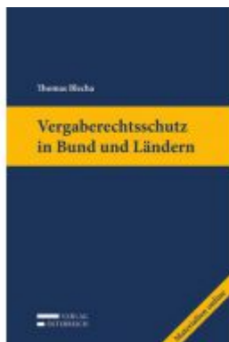
Vergaberechtsschutz in Bund und Ländern Ladenpreis: 199,00 EUR