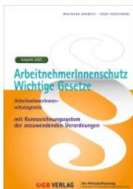
ArbeitnehmerInnenschutz. Ladenpreis: 39,90 EUR