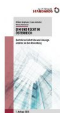
BIM und Recht in Österreich Ladenpreis: 29,70 EUR