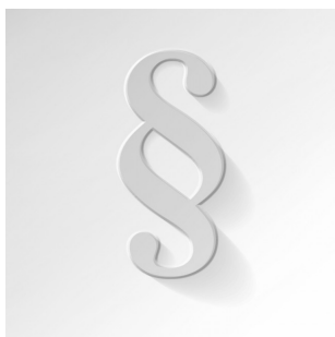
System des österreichischen allgemeinen Privatrechts / Das Erbrecht