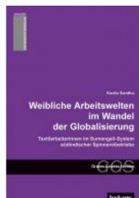
Weibliche Arbeitswelten im Wandel der Globalisierung. Textilarbeiterinnen im Sumangali-System südindischer Spinnereibetriebe.