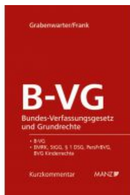
Bundes-Verfassungsgesetz und Grundrechte B-VG Ladenpreis: 98,00 EUR